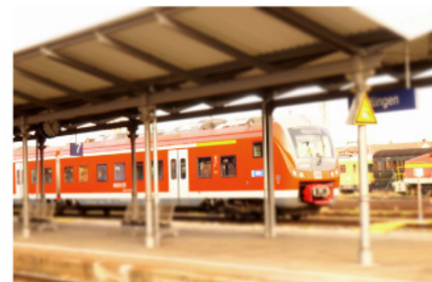
移動は全て電車。時刻表を照らし合わせながら現地ドイツ鉄道を堪能してきました