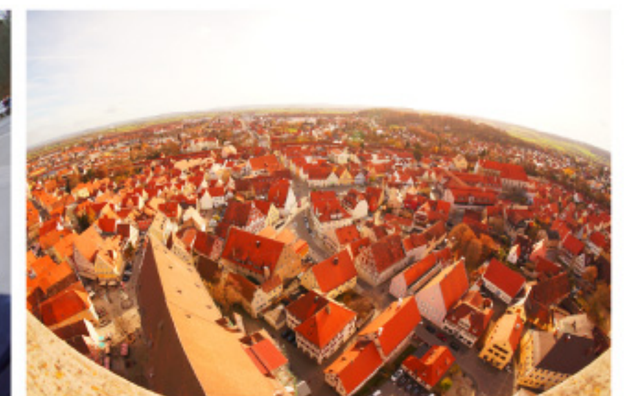
城壁で囲まれた限石でできた街「ネルトリンゲン」