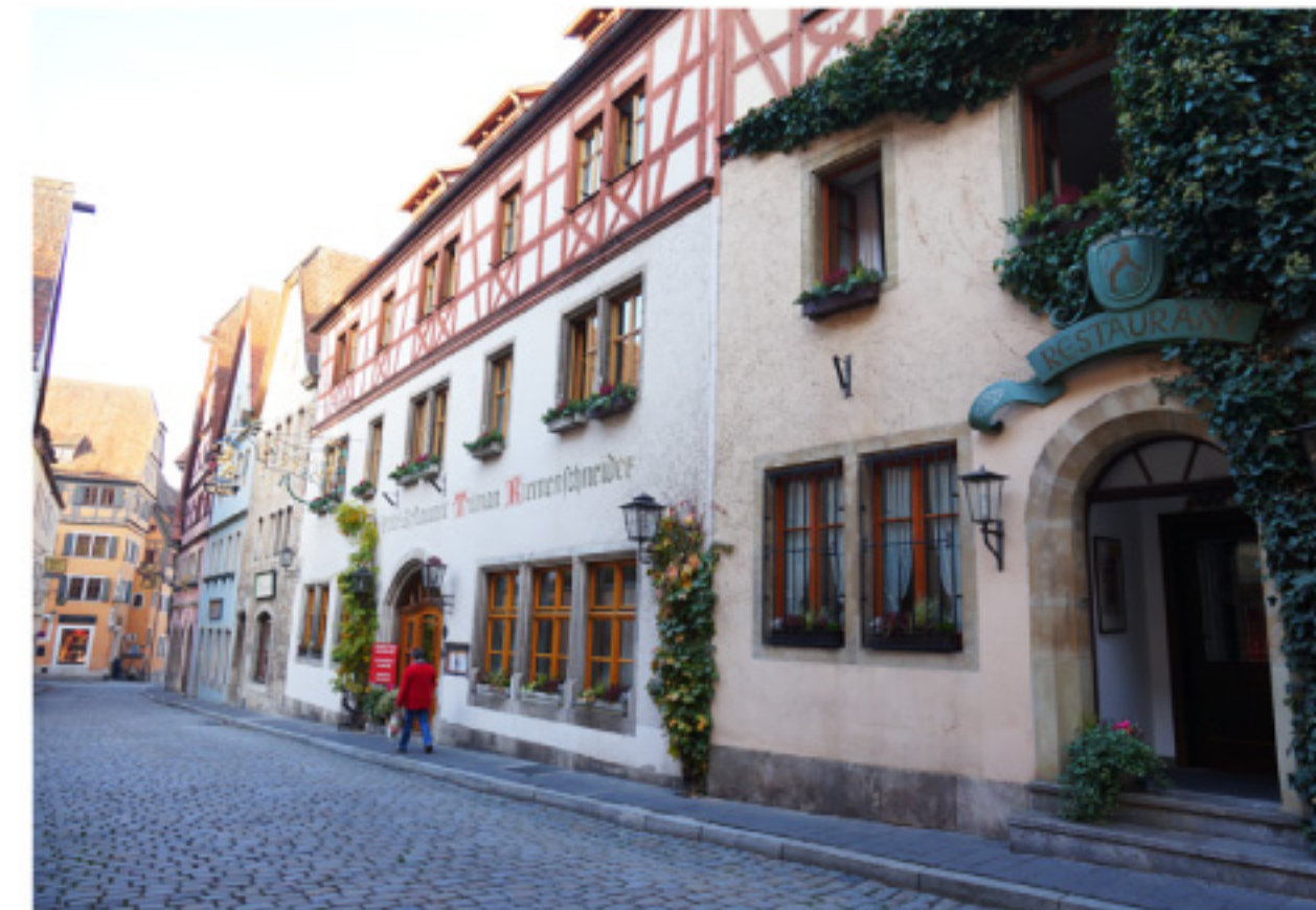
ロマンティック街道を南下してきました「ローテンブルク」の町並み

今年の社員旅行は小グループに分かれ、目的や社員旅行の意味を明確にしたコンセプトのもと、リフレッシュした社員旅行を行っております。先日ドイツへ行ってきました女子チームをご紹介します。