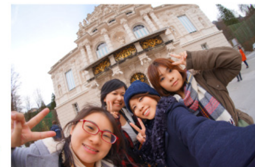
調査兵団チーム 女子メンツで行ってまいりました!

「異文化交流」友好国の歴史に触れる。教会などの歴史的建造物を漫喫スケジュール管理(電車での移動)ツアーではなく自分たちで計画を立て、計画性と柔軟性を養う。チームワークの発揮。映画の世界観を満喫する。初ドイツ語にチャレンジ!