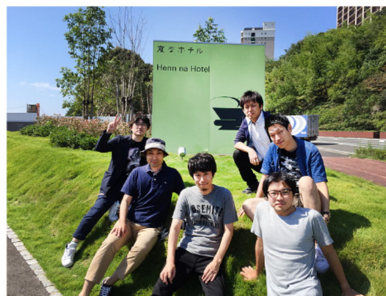
修学旅行チームのメンバー 長崎へ行ってきました!

今年の社員旅行は小グループに分かれ、目的や社員旅行の意味を明確にしたコンセプトのもと、リフレッシュした社員旅行を行っております。先日長崎へ行ってきました「修学旅行チーム」をご紹介します。