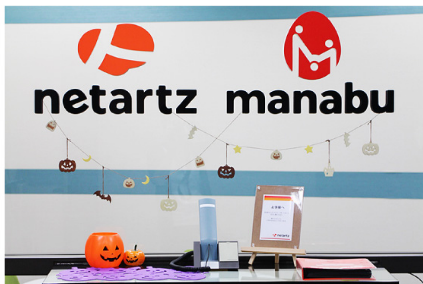
エントランスにてプチハロウィン開催中!