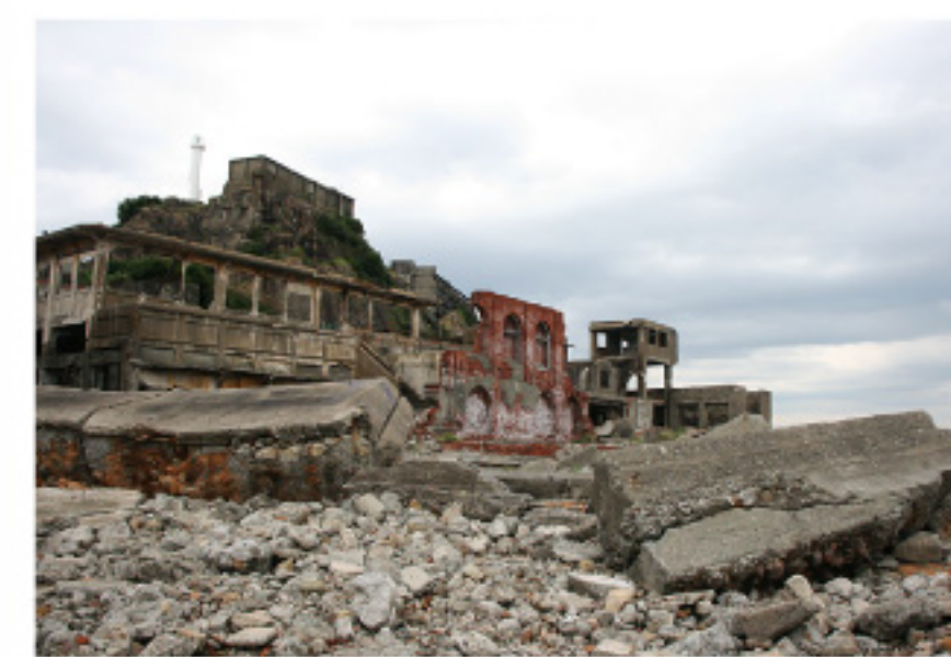
世界遺産に認定された軍艦島へ