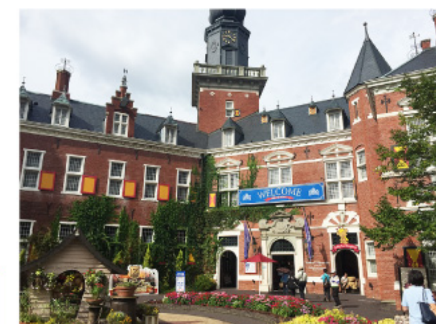
復興された長崎ハウステンボスへ 行ってきました

「変なホテル」の最先端の技術をみる。復活したハウステンボスでメンバーの親睦を深める。今話題の世界遺産、軍艦島を自分の目で見て、歴史的建造物へ訪れ教養を高める。 戦後70年の節目に長崎を訪れあらためて戦争について考えてみる。