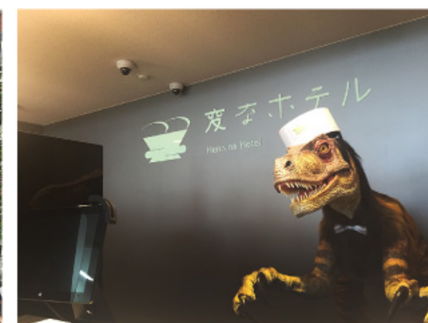
「変なホテル」は何と受付のスタッフが 全てロボットです!!