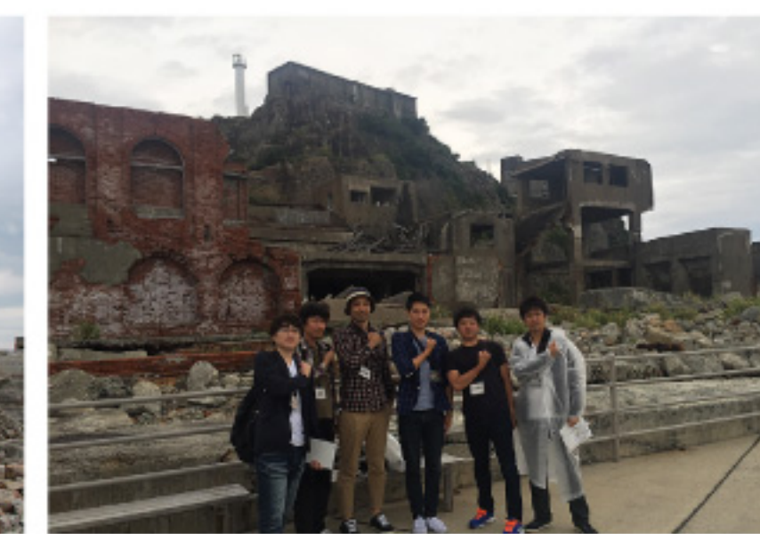
歴史的建造物や長崎を訪れ戦争について 感慨深いものがありました