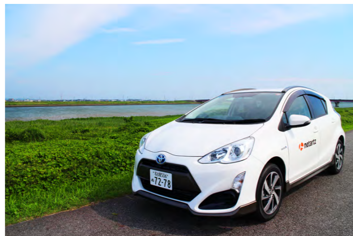
社用車のロゴも新しくなりました