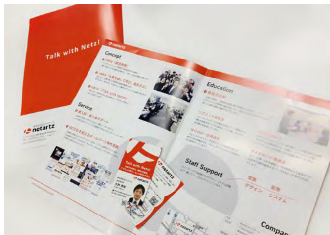
会社パンフレット

コミュニケーションを通して生まれる繋がりによって、IT がお客様の身近な存在となるようお手伝いします！