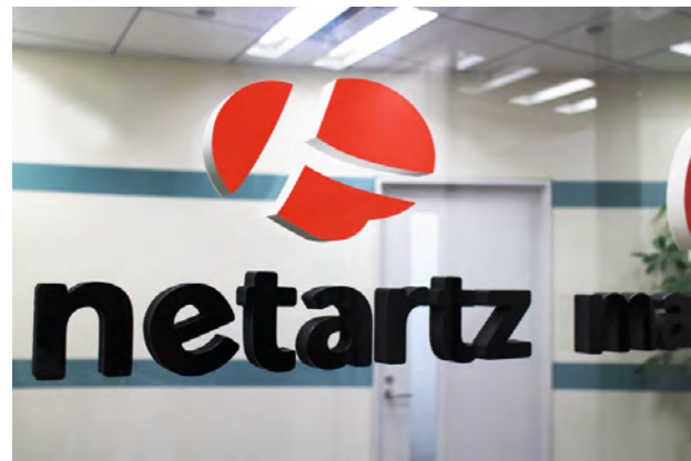
エントランスのロゴが新しくなりました

今月からリブランド委員会による社内報「ネットアーツ広報新聞」が創刊されました！この社内報を通じて、ネットアーツの活動状況や、知って得する IT 豆知識、自社開催セミナーなど、様々な情報をお伝えしていきます。 今後とも「ネットアーツ広報新聞」をよろしくお願いいたします（＾＾）